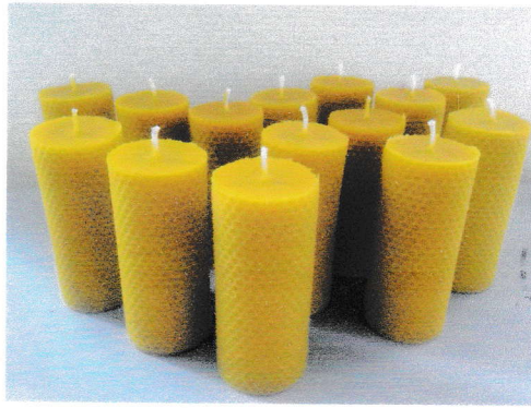
LA CIRE d'ABEILLE