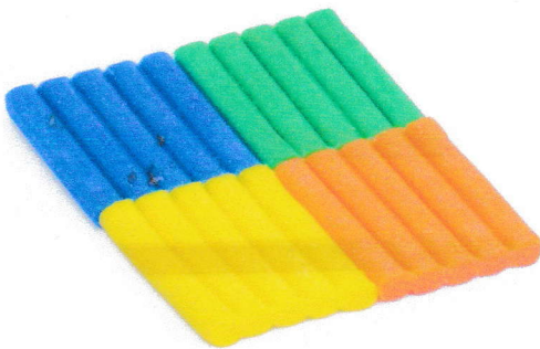
LA CIRE d'ABEILLE