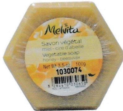
LA CIRE d'ABEILLE