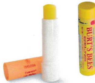
LA CIRE d'ABEILLE